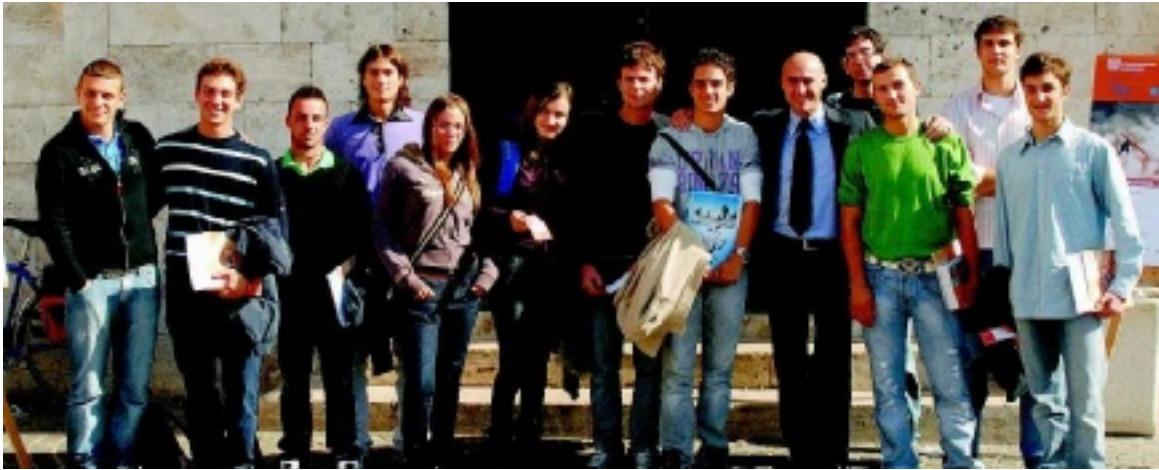
FOTO DI GRUPPO Per i tredici studenti impegnati in due giorni di visite in aziende del Nord Italia. Visite dedicate in modo particolare all'innovazione tecnologica che guarda sempre più verso il futuro